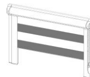
Model 23 / 24